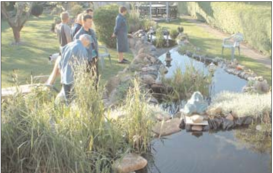
Havebassinggruppen på besøg på Rolighedsvej i Slagelse 13. maj 2002.