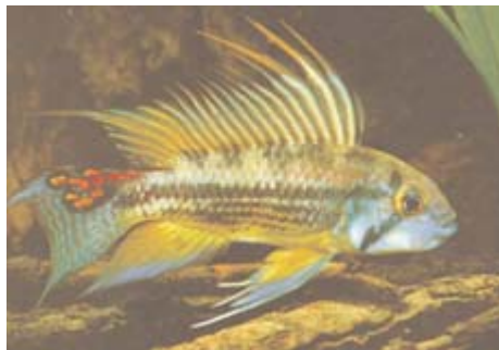
Illustrationen viser en A. cacatuoides (han)

En temperatur på ca. 25 grader, god filtrering over et udvendigt Eheim-filter (den lille standardmodel, mit er 25 år gammelt, men fungerer upåklageligt endnu og kan stadig repareres, hvilket kun drejer sig om at udskifte aksel og rotor med 20 års mellemrum).