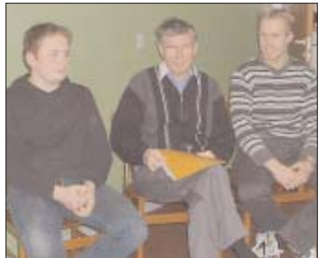
Det vindende hold fra Ølstykke.

Dagen sluttede med auktion over et meget lille antal fisk.