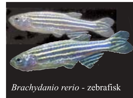
Brachydanio rerio - zebrafisk

rasbora. Som eksempler kan nævnes R. einthoveni , R. dosciocellata , R. elegans og R. trilineata .