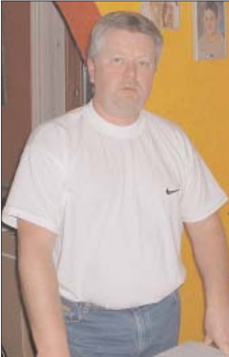
Erling fremlægger beretningen.