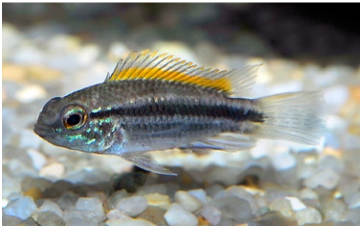
Apistogramma bitaeniata , hun.

Vigtigt: Hvis du skal medicinere må du aldrig give malakitgrønt. Den medicin kan slå fisken ihjel.