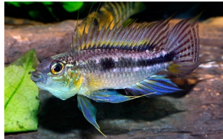
Apistogramma bitaeniata , han. Foto: ©Akvariefoto.dk

Copyright Foreningen Akva-Net. Gengives her med foreningens tilladelse.