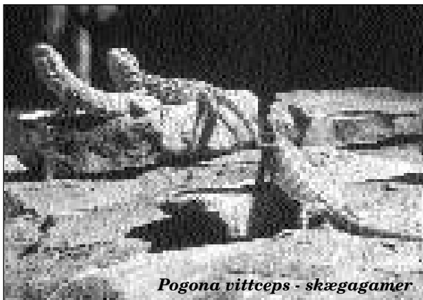
Pogona vitticeps - skægagamer

Poul Wismann, tlf. 58 53 47 41 senest onsdag den 7. oktober