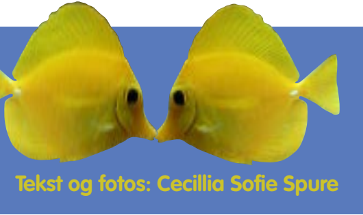
Tekst og fotos: Cecillia Sofie Spure

to; på den måde kan man bedre fordele aggressionerne.