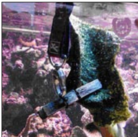
Hjemmelavet foderklemme med Nori Tang

Uspiste blade og tang tages op af akvariet efter et par timer.