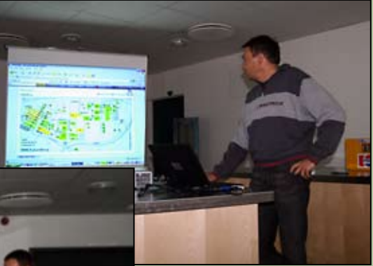
Den omfattende teknik blev kikket nøje efter i sømmene