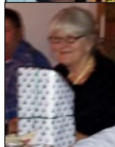
Lis vandt mandelgaven.