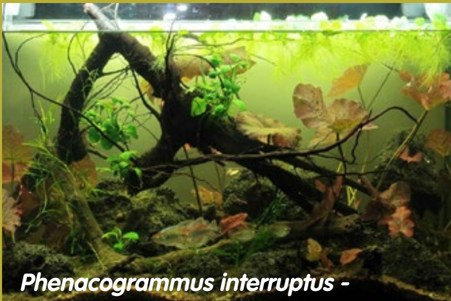
Phenacogrammus interruptus -