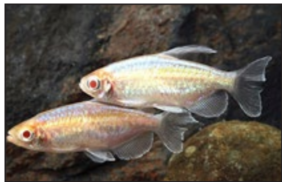
Fiskene på billedet er albino Congo tetra made in Indonesia. Dem kan man godt se bort fra, for dette handler om den naturlige form.

Efter 6 døgn klækker æggene. Når ungerne svømmer frit skal du begynde med at fodre med infusorier og lidt senere frisk klækkede artemia.