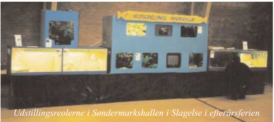
Udstillingsreolerne i Søndermarkshallen i Slagelse i efterårsferien