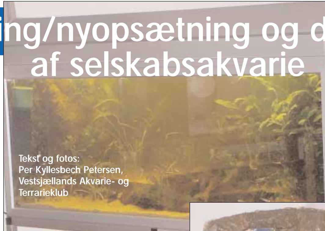
Tekst og fotos: Per Kylesbech Petersen, Vestsjællands Akvarie- og Terrarieklub

Skab dybde i akvariet, gerne med hjælp af en baggrundskasse - Tving øjet til at betragte akvariet fra venstre og ind i akvariet, f.eks. med et åbent kileformet arealer med fri svømmeplads i midten - Planter plantes i grupper bortset fra en eller få solitärplanter -Terrasseopbygget eller fra bagruden mod forruden