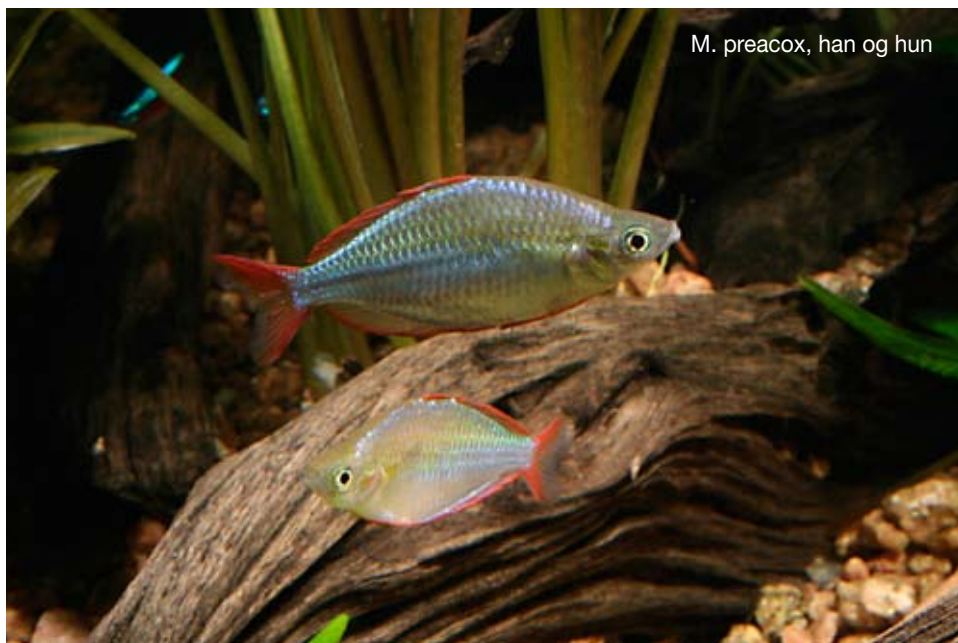
M. praecox , han og hun

Kønsforskellene hos Melanotaenia praecox er ikke noget der lige sprin-