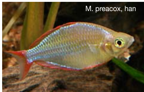
M. preacox, han

at skelne hunner fra yngre hanner, men her er det som altid en god ide at kigge på bugen, hvor hunnen er fyldigere end hannen.